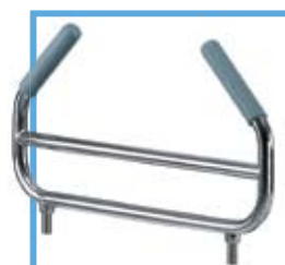
Szczyt nóg WW-08.0