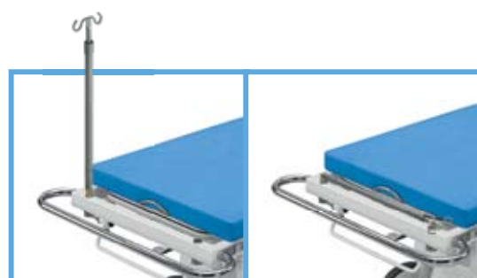
Łamany wieszak kroplówki WK-14.0