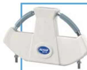
Szczyt głowy WW-07.0