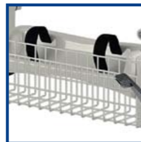
Kosz na podręczne rzeczy pacjenta