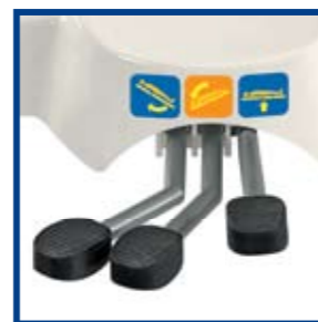
Zespół dźwigni pompy nożnej