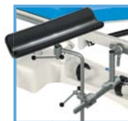
Podpórka kątowa ręki WS-07.5 montowana na listwach bocznych