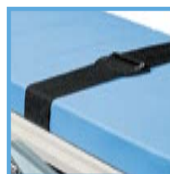
Pas do mocowania pacjenta WW-12.0